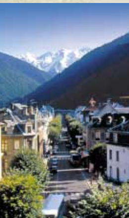
Luchon : Allée d'Etigny

Les travaux de rénovation de l'Hôtel Aquitaine ont permis de le doter d'installations confortables en lui conservant la beauté de son architecture du XIX e siècle, époque de la découverte des Pyrénées par l'Europe entière. L'hôtel est situé face au lac et au parc thermal, il vous suffira de quelques minutes pour vous rendre à l'espace thermal ou pour profiter de l'animation du centre ville.