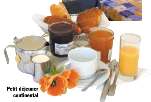
Petit déjeuner continental